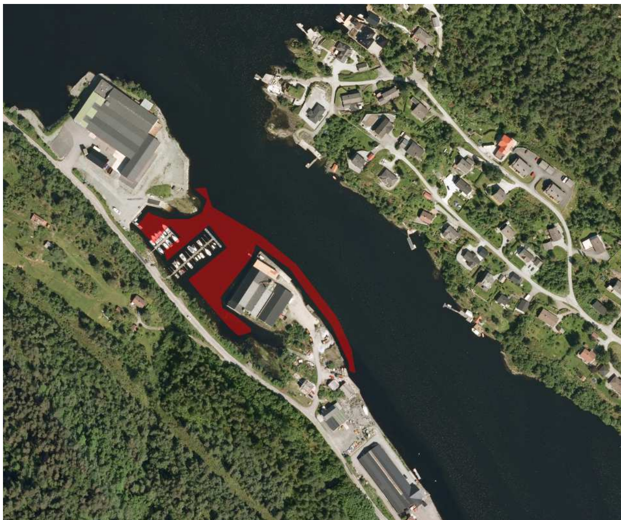
Figur 2 Kart over undersøkt område. Kart: Statkart